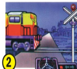
2 Los vehículos ferroviarios.