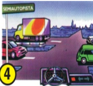
4 Los peatones que cruzan ilícitamente la calzada por la senda peatonal o en zona peligrosa marcada como tal.