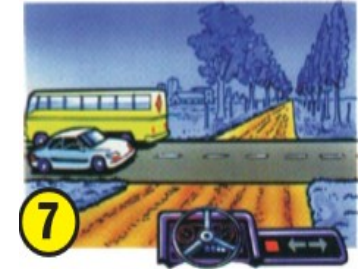
7 Cuando se desemboque de una vía de tierra a una pavimentada.