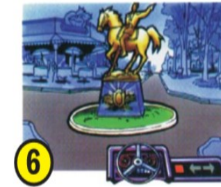
6 Las reglas especiales para rotonda.