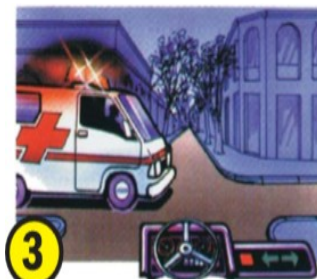
3 Los vehículos del servicio público de urgencia de servicio.