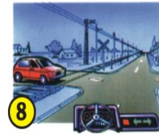
8 Se circule al costado de vías férreas, respecto del que sale del paso a nivel.